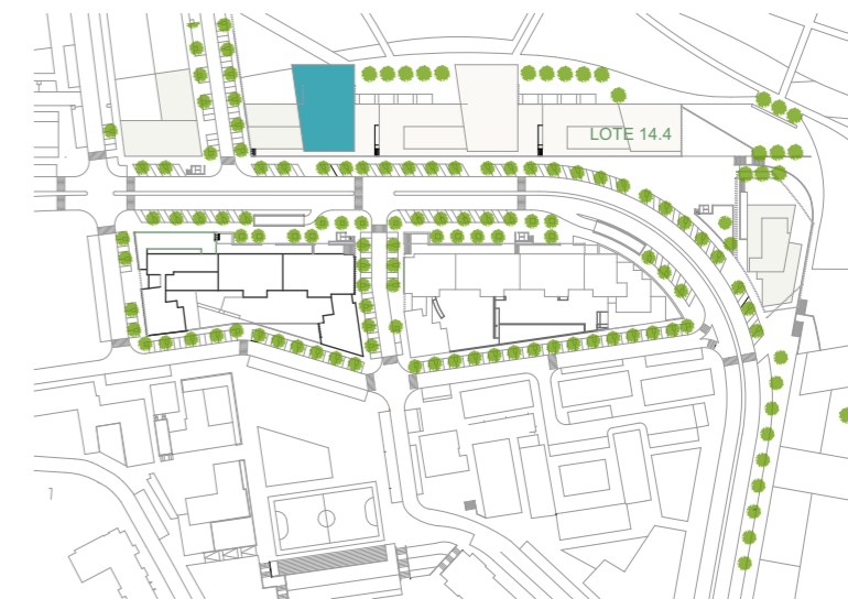
Localização na Malha