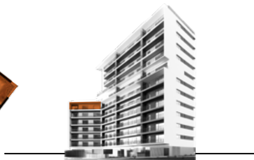
Orientação: Sul Orientation: South

Sem escala. Os elementos constantes deste documento são meramente indicativos e não têm caráter contratual. Not to scale. All the information on this document is purely illustrative and can be subject to change. It is not contractually binding.