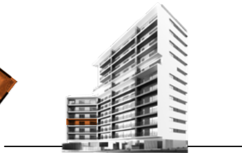
Orientação: Sul Orientation: South

Sem escala. Os elementos constantes deste documento são meramente indicativos e não têm caráter contratual. Not to scale. All the information on this document is purely illustrative and can be subject to change. It is not contractually binding.