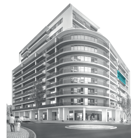
Orientação: Oeste Orientation: West