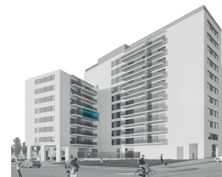
Orientação: Este Orientation: East